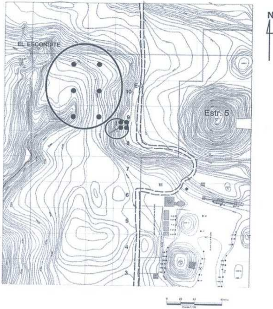
Figura 1. Mapa con los puntos de ubicación de las operaciones a realizarse en 2015.